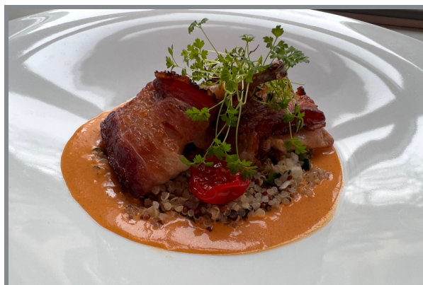
Перепелка в говяжьем беконе с киноа и соусом карри