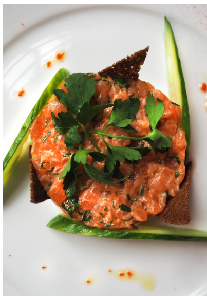
Тартар из лосося