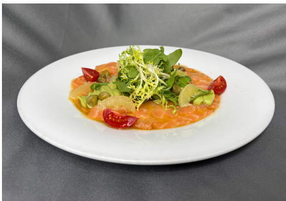
Карпачо из лосося