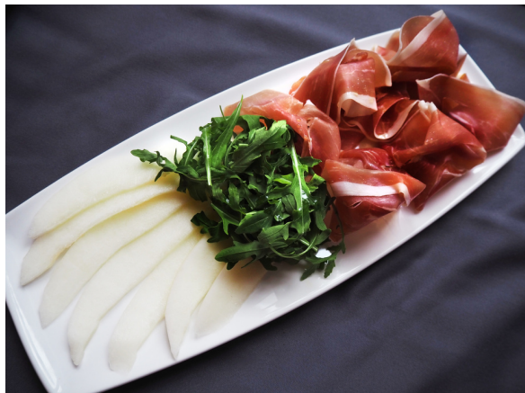
Пармская ветчина с дыней