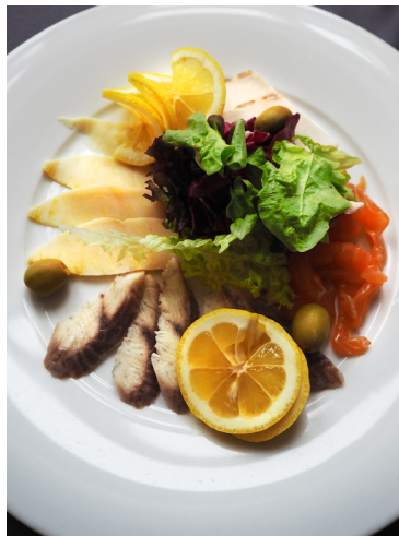
Рыбное ассорти (масляная рыба, палтус, осетрина, лосось сл/с)