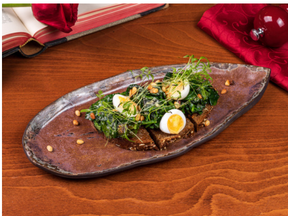
Брускетта со шпинатом и пармезаном (3шт)