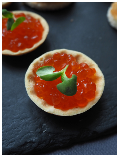
Канapé с красной икрой в корзинке