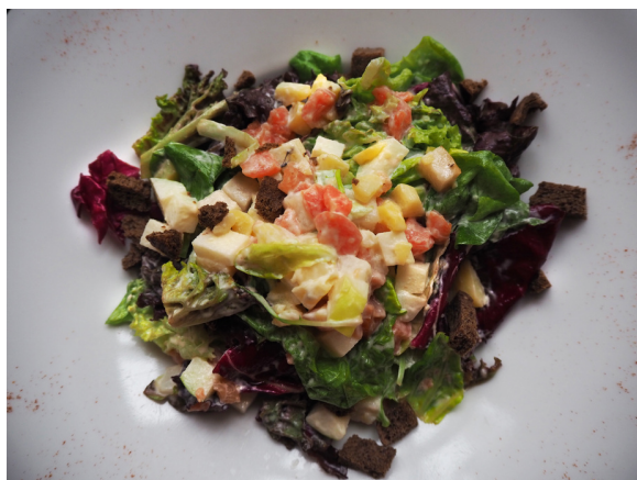
Меланж (копченый лосось, масляная рыба, микс салатов, ароматные гренки из черного хлеба)