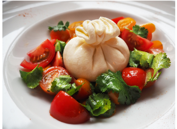
Буратто с томатами