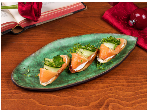
Брускетта с лососем (3шт)