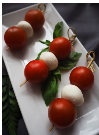
Канapé томаты моцарелла