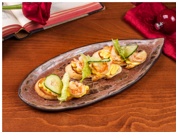
Брускетта с креветками (3 шт)