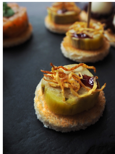
Канapé с пате фуагра и имбирным чипсом