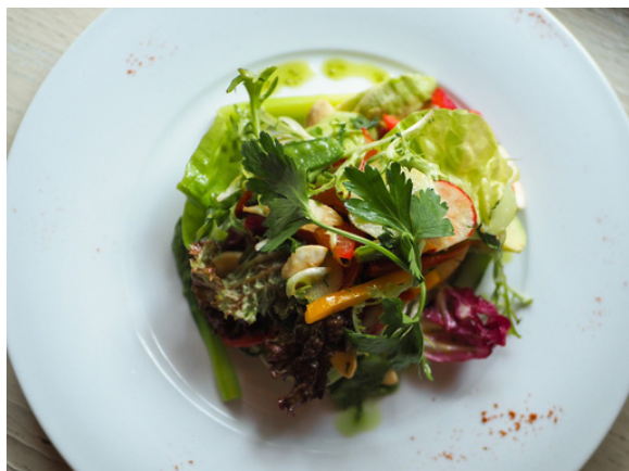
Вежитель (ассорти свежих овощей с ароматом имбиря)