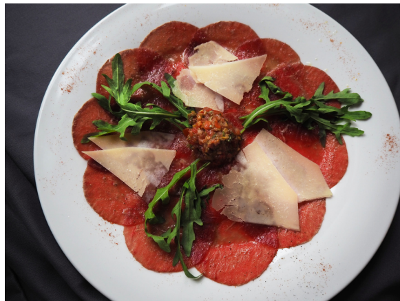
Карпачо из говяжьей вырезки