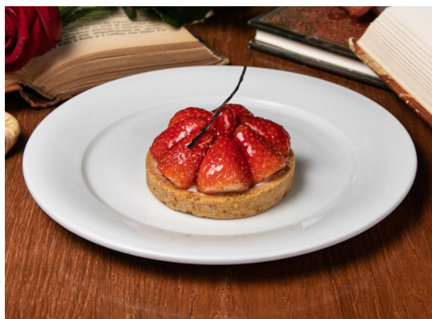
Тарталетка с клубникой