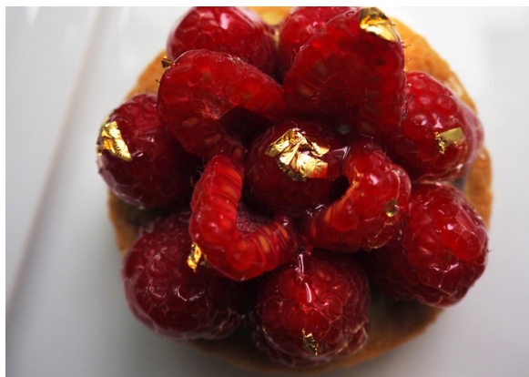
Тарталетка с малиной и фисташковым кремом