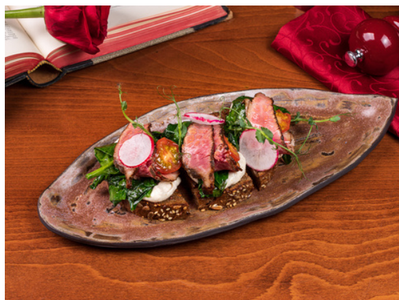
Брускетта с пастроми, шпинатом, томатами и соусом из тунца