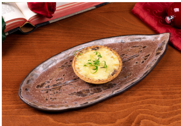
Грибной жульен в корзинке