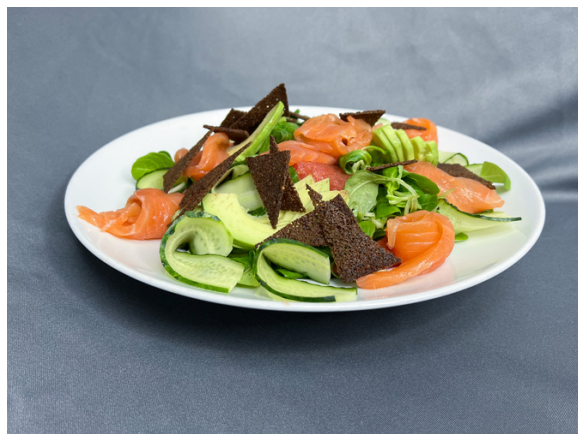
Nordique (легкий салат с лососем, грейпфрутом, авокадо, подается с йогуртовым соусом)