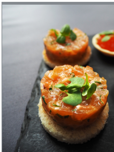
Канapé тартар из лосося