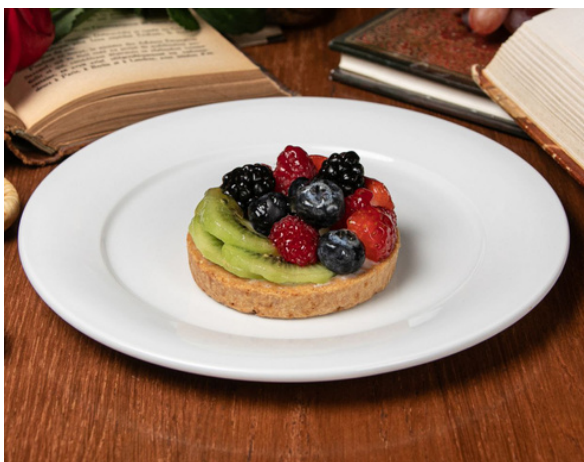
Тарталетка с лесными ягодами