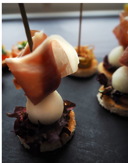
Канapé с пармской ветчиной и дыней