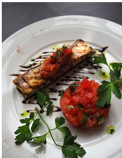
Киш из баклажанов