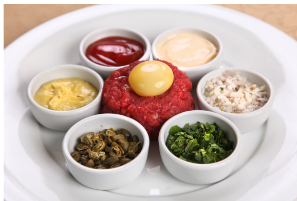
Тартар из говяжьей вырезки