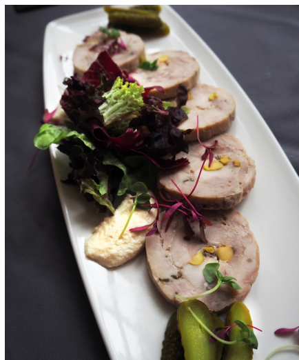
Рулет из кролика с фисташками