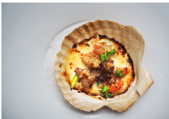
Гребешок, запеченный в сливочном соусе с беконом и спаржей