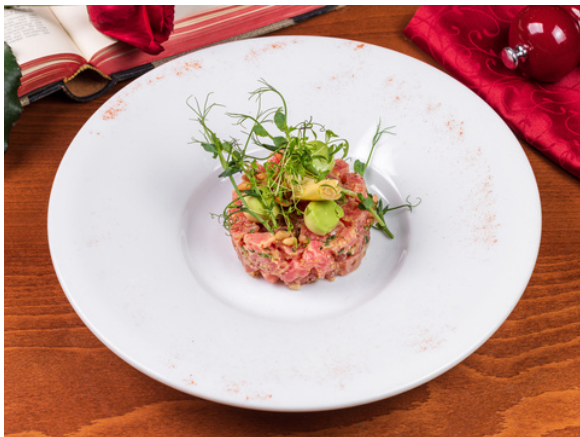
Тартар из тунца