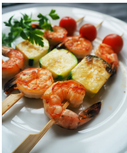
Королевские креветки на шпажке