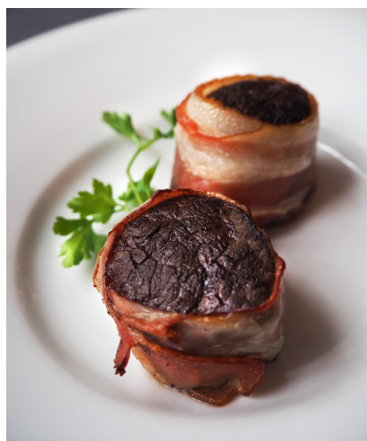
Медальоны из говядины 2 шт