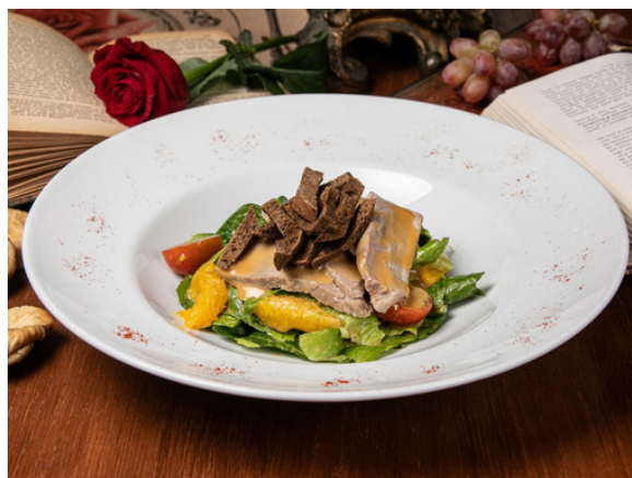
Мишель (обжаренная утиная грудка, апельсин, медово-горчичная заправка, томаты черри, гренки из черного хлеба)