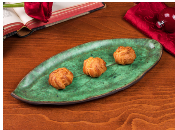
Профитроли с козым сыром