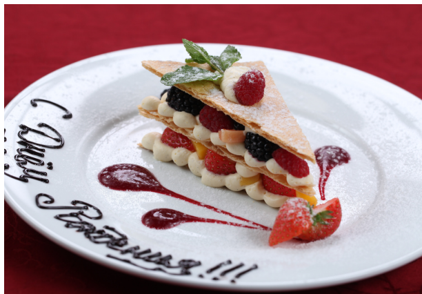
Мильфей с фруктами и ягодами