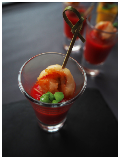
Гаспачо с креветкой