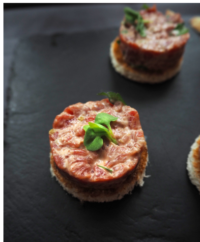
Канapé тартар говядина