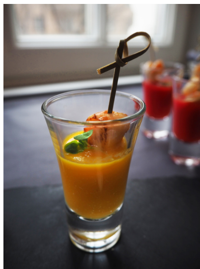
Шот с гребешком и кулисом из желтого перца