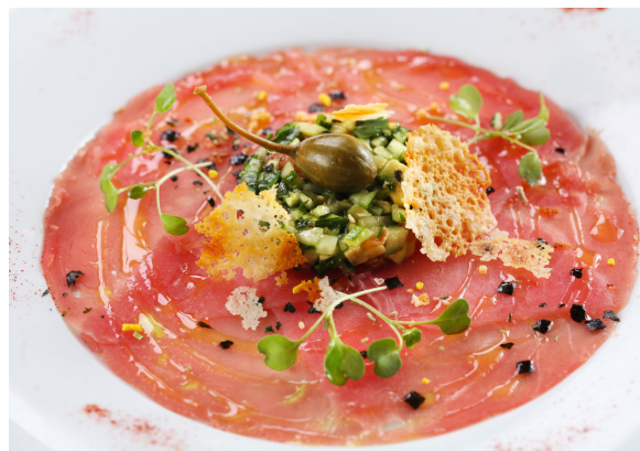
Карпачо из тунца