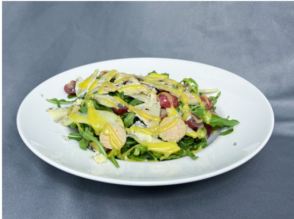
Салат с грушей и пате фуагра (руккола, виноград, патэ фуа-гра, сыр стилтон, груша, яблочный винегрет)