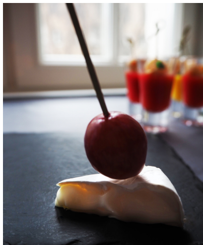
Камамбер с виноградом и винной карамелью