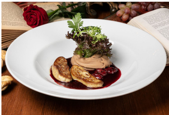
Фуа-гра с пюре из каштанов и вишневым соусом